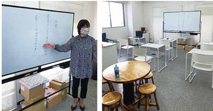
とても静かで落ち着いた環境の中、集中して学習に臨みます。白を基調としたとても明るい教室です。

千葉県東金市 東岩崎 25-12 サンイースト東金 30 B J R 東金線・東金駅から徒歩 7 分 0475-78-5103 090-1806-2363（相談窓口）