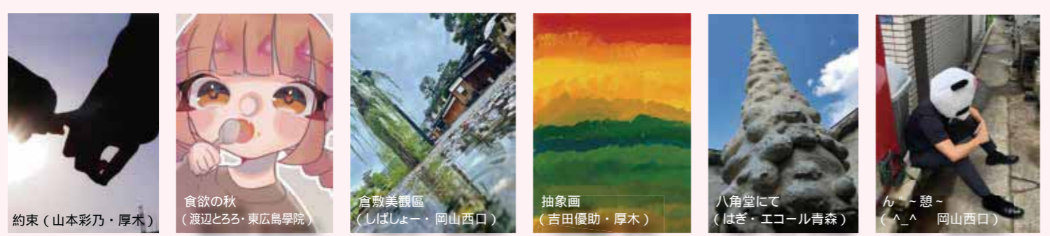
約束 (山本彩乃・厚木) 食欲の秋 (渡辺とろろ・東広島学院) 畜養美観区 (しばしょー・岡山西口) 抽象画 (吉田優助・厚木) 八角堂にて (はぎ・エコール青森) ん~憩~ (^_^) (岡山西口)