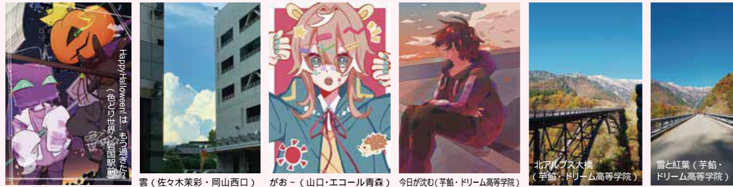
Happy Halloween! (山本彩乃・厚木) 雲 (佐々木葉彩・岡山西口) がお~ (山口・エコール青森) 今日が沈む(芋館・ドリーム高等学院) 北アルプス大橋 (芋館・ドリーム高等学院) 雪と紅葉 (芋館・ドリーム高等学院)

写真・イラスト・ムービー各部門で作品を募集した鹿島朝日高校の「WEB文鹿祭」。テーマフリーということもあり、全国の鹿島朝日生からバラエティに富んだ楽しい作品が、計140点も集まりました！作品を送ってくださった皆様には心より感謝したいと思います。ここでは、数多くの作品の中から、特に人気の高かった作品をご紹介します。すべての作品はWEBで掲載中ですので、ぜひチェックしてください！！