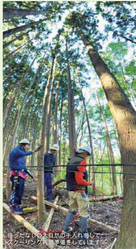
待ったなしの大自然の手入れをして、スクーリング再開準備をしています