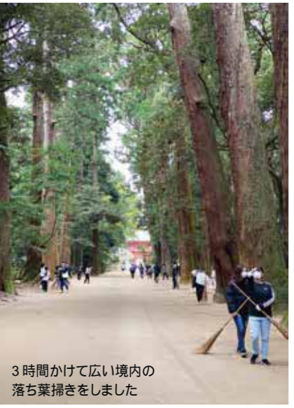
3時間かけて広い境内の落ち葉掃きをしました