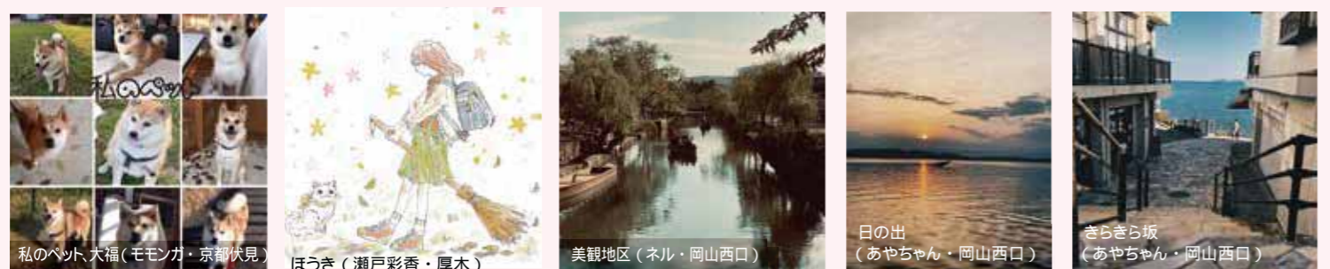
私のペット大福 (モモンガ・京都伏見) ほうき (瀬戸彩香・厚木) 美観地区 (ネル・岡山西口) 日の出 (あやちゃん・岡山西口) きらきら坂 (あやちゃん・岡山西口)