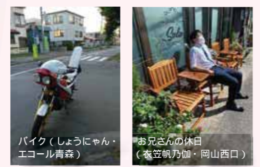
バイク (しょうにゃん・エコール青森) お兄さんの休日 (衣笠帆乃加・岡山西口)

応募全作品は「カシマの通信ホームページ」内、鹿島朝日 文鹿祭イベントページにて公開中！ www.kg-school.net/asahi/festival/