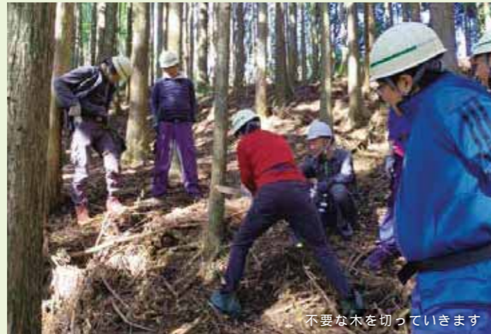
不要な木を切っています