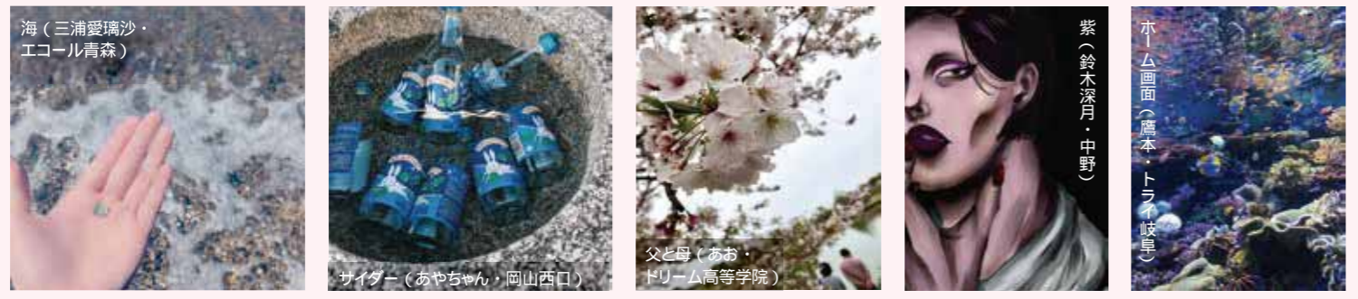
海 (三浦愛璃沙・エコール青森) サイダー (あやちゃん・岡山西口) 父と母 (あお・ドリーム高等学院) 紫 (鈴木深月・中野) ホム画面 (高本・トライ岐手)