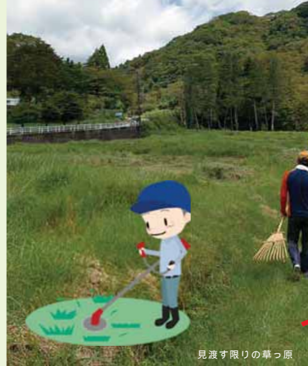
見渡す限りの草っ原