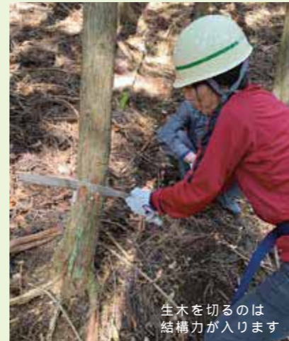
生木を切るのは結構力が入ります

インターネットを通して簡単に「知る」ことはできますが、体験することで「理解」できることもあるんだ、ということを通して「体験」して欲しいと願っています。