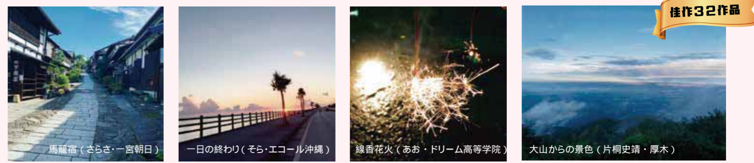
馬籠宿 (さらさ・一宮朝日) 一日の終わり (そら・エコール沖縄) 線香花火 (あお・ドリーム高等学院) 大山からの景色 (片桐史靖・厚木)