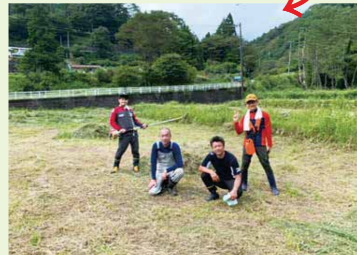
地面が少し顔をだしました！ふいー

ようやく田んぼ予定地の草刈り完了！米作りの達成感を来年度はスクーリングに来た皆さんと味わいたい！さあ！これから耕して、水を引き込めるようにして…田植えまでの道のりは長～い！みんなで田植え実現するか？！乞うご期待