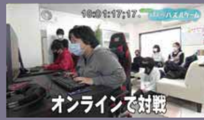
オンラインで対戦

気軽に入りやすいパズルゲーム(ぶよぶよテトリス)のほか、ロケットリーグ、フォートナイト、PUBG、Apex Legendsなどを楽しみながら練習に励んでいます!