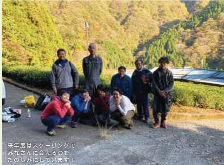
来年度はスクーリングでみなさんに会えるのをたのしみにしています！

山北スクーリングには都会では体験できない大切なこと、先生方の愛情がぎゅーと詰まっています！