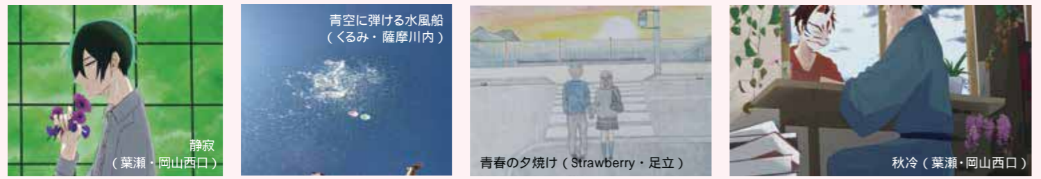
静寂 (葉瀬・岡山西口) 青空に弾ける水風船 (くるみ・薩摩川内) 青春の夕焼け (Strawberry・足立) 秋冷 (葉瀬・岡山西口)