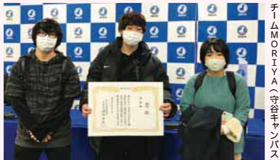
チームMORIYA(守谷キャンパス)

決勝では両者競り合い、最終5試合目に突入! チームMORIYAも粘り強く戦いましたが、おしくも軍配は相手校に。