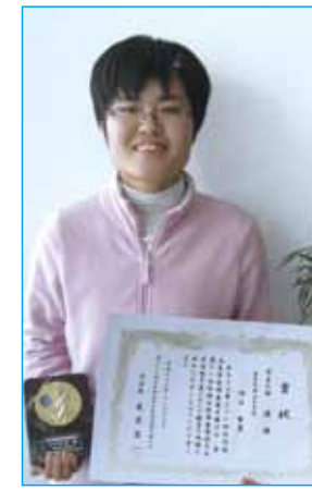
北信越高校囲碁選手権大会で優勝

私が現在、力を入れている事は囲碁です。私が囲碁と出会ったのは小学校3年生のときです。何か習い事をしたいなあと考えたときに、親の送迎なしに自分一人で通えるところに行こうと思いました。そんな時に、家の近所で囲碁が目にとまり、兄も少し囲碁が出来たことや、当時、「ヒカルの碁」というマンガが好