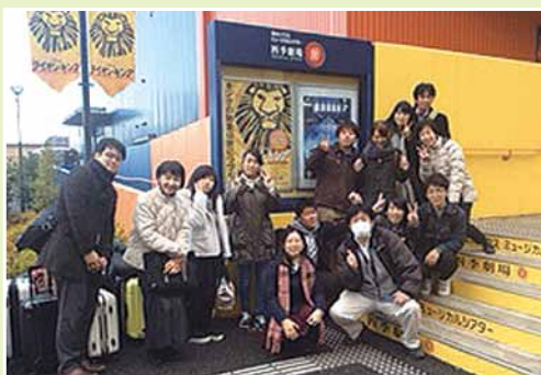
念願のライオンキング

初の修学旅行! 東京へ2泊3日の旅!! 初日は、9月に開校したばかりの「鹿島山北高等学校」訪問。先生方手作りのボルダリング施設にBQと丹沢湖のほとりにある自然いっぱいの山北を満喫しました。2日目は、劇団四季「ライオンキング」観劇。都内自由行動では、