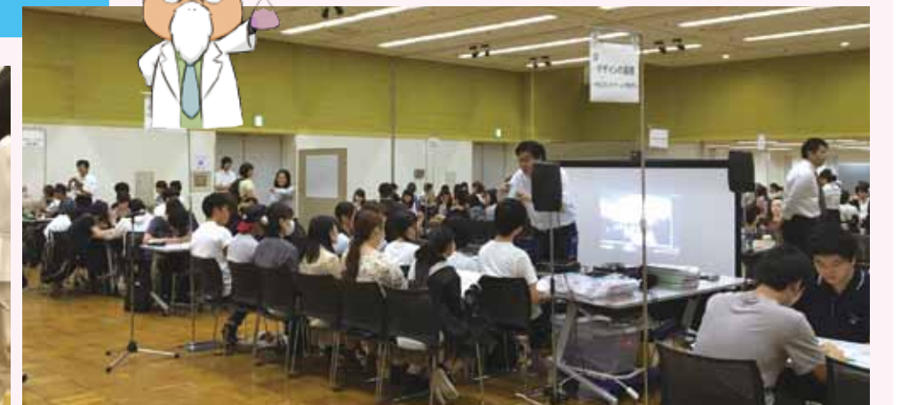
進路の可能性を広げます! 様々な職業を知り、実際に体験