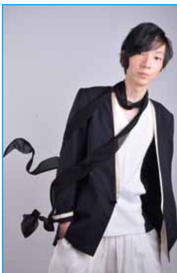
カシマでは「がんばる生徒」を 全力でサポートします

校歌制作プロジェクト進行中! 全国のキャンパスで 生徒が創った校歌が流れる 日を夢見て! 生徒が作詞を担当、作曲を大野靖之さんにお願ひし今春スタートした「鹿島朝日高校校歌制作プロジェクト」。広く呼び掛けた結果、全国から素敵な言葉やフレーズが! 現在大野さんは、その言葉を紡ぎ、曲にする作業に入られています。