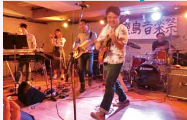
教員も生徒もこの日は思い切り楽しめます! 上の演奏は職員バンド