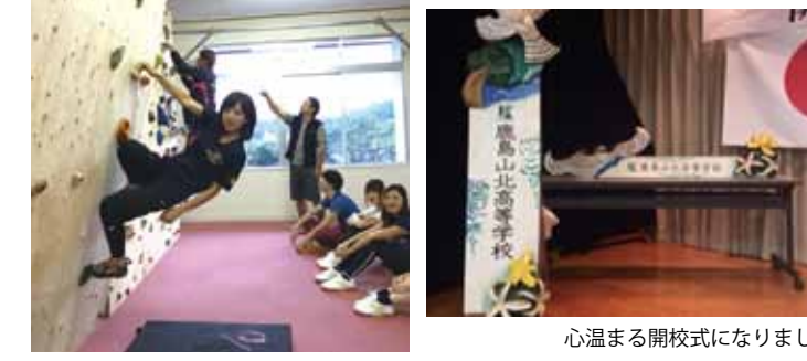
心温まる開校式になりました

編集後記 今回「鹿の子通信」も5回目の発行となり、我々も回るごとに随分編集部らしくなってきました。これからも皆様に楽しんでいただけるよう、精進して参ります。次号の発行は来年夏を予定しております。お楽しみにお待ちしております。また、編集部では随時原稿を募集しております。たくさんのご応募お待ちしております。 ▼原稿募集▼ 「Topics」……大会出場、入選、入賞、合格など、皆さんにお知らせし、一緒に笑顔になれる話題を募集します。 「イベント紹介」……地方色豊かなイベントを御紹介ください。 「イラスト展覧会」……皆さんの作品をお待ちしています! 詳細はイラストコーナーをご参照ください。 「キャンパス紹介・生徒紹介」……キャンパスで頑張っている生徒や、キャンパスでの面白い取り組みを紹介ください。 「OB・OG紹介コーナー」……頑張っている卒業生の姿をお知らせください。キャンパスからの推薦もお待ちしております!