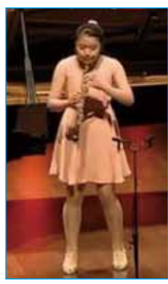
ニース国際音楽アカデミー選抜コンサートにて(世界中にライブ配信)

入部した事がきっかけでオーボエを始め、めきめきと頭角を現す。全日本音楽コンクール第3位(1位なし)、全日本ソロンコンテスト全国大会・北爪道夫賞受賞。また、チロル国際アカデミー受講生選抜コンサート、ニース国際音楽アカデミー受講生選抜コンサートに出演。これから更なる活躍が期待されます。