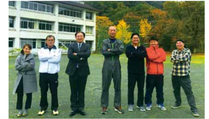
上: エネルギーな職員でスタートします! 左: 室内で本格的なボルダリングも!

き詰められ、ボルダリング施設なども建設されました。また、音楽室や図書室、校庭や体育館などは今ある施設を活用します。 授業は通常の科目だけでなく、地域振興のための観光のあり方や、農林業体験を通じて環境について学ぶ等、山北町の特徴に合わせた授業も行います。山北町の大自然と、生徒にとってかけがえのない「心のエネルギー」となる事と思います。 鹿島山北高等学校は、卒業してからもここで過ごした時間が「心の糧」となるような場所を目指します!