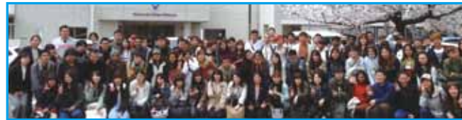
信州の恵まれた自然の中で和やかに学んでいます

きたったこともあり習い始めました。現在は囲碁教室に通うほか、地元の有段者と対局し腕を磨いています。そうした努力が実を結び、北信越大会では全勝で優勝し、全国大会へと出場する事が出来ました。囲碁を習って良かったことは、集中力が身についたこと、全国に友達が出来たことです。通信制では通学日数も自由に決められるため、登校しない日は囲碁に時間を取ることができ、勉強とも両立が出来て時間を有効的に使えています。毎日の勉強の傍ら、教時間は基盤に向かっています。