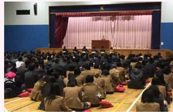
通信制湘南キャンパス3年、岩間華穂さんが 最優秀賞!! 大勢の人の前での意見発表は自 信につながります!