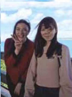
ネイティブの先生との 貴重な交流