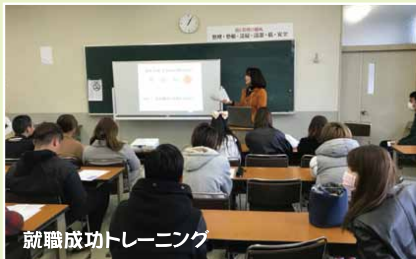
就職成功トレーニング