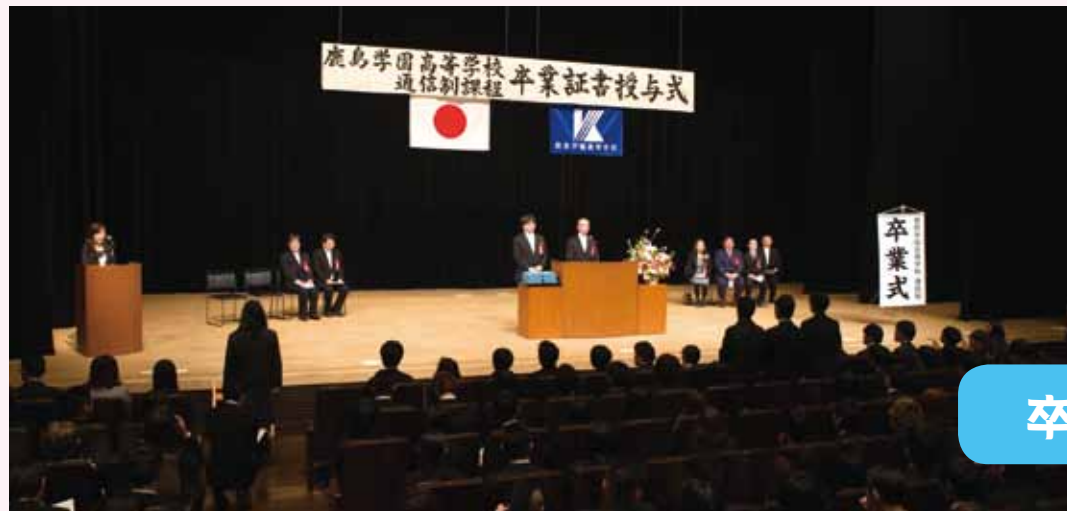
一人一人の名前が呼ばれていきます...